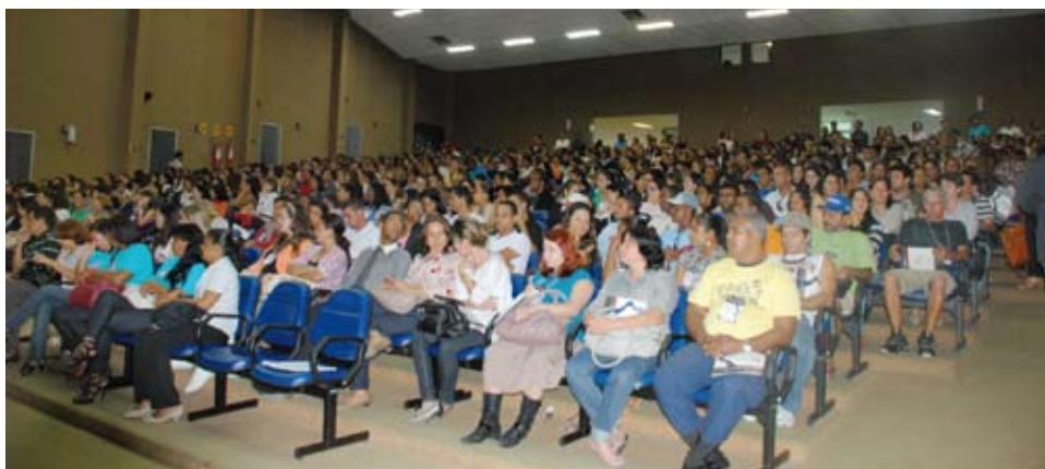
Um público comprometido com a questão das drogas lotou o auditório

A mesa-redonda “Prevenção e Intervenção em Crack, Álcool e Outras Drogas” teve dois assuntos pontuais, entre outros. Um deles, o relato das ações desenvolvidas pelo Cetad/Ufba junto às populações de bairros populares e mora-