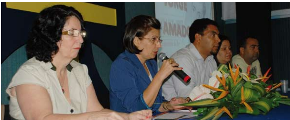
Flagrante da instalação do Ciclo

O evento é um dos mais tradicionais da Universidade Estadual de Santa Cruz