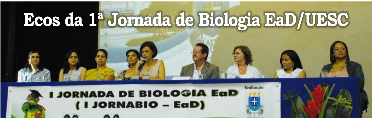
Mesa de abertura do evento

Público superior a 240 participantes – estudantes dos cursos de Biologia nas duas modalidades de ensino: a distância e presencial da UESC e UESB, de faculdades particulares e de profissionais da área participou da I Jornada de Biologia (Jornabio), promovida pelo Colegiado de Biologia-EaD e o Departamento de Ciências Biológicas da Universidade. Centrado na temática “Biologia, Sociedade e Conhecimento: Educação Contemporânea” o evento, realizado em setembro (3 a 6), promoveu por meio de palestras, mesas-redondas, minicursos e outras atividades, a atualização de conhecimentos na área das ciências biológicas.