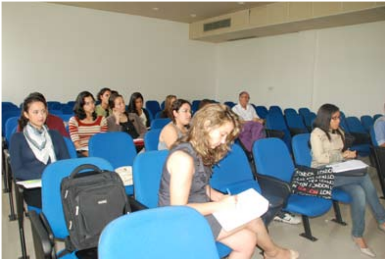
Participantes do curso

O Centro Acadêmico Barão de Rio Branco, que congrega os alunos de Línguas Estrangeiras Aplicadas às Negociações Internacionais (LEA) e a Focus R.I. promoveram, este mês (20 e 21), um Curso de Internacionalização de Empresas, com o objetivo de capacitar pessoas e empresas nas técnicas e práticas da negociação internacional privada. Aos participantes foram ministrados os principais elementos que devem ser considerados na construção de uma estratégia de internacionalização de pequenas e médias empresas, tais como marketing, estruturas empresariais, acesso a mercados. Proporcionou também a discussão e identificação de estratégias de internacionalização mais adequadas a cada tipo de empresa.