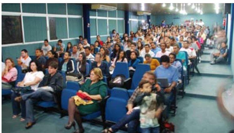
Professores, estudantes e egressos do curso de História