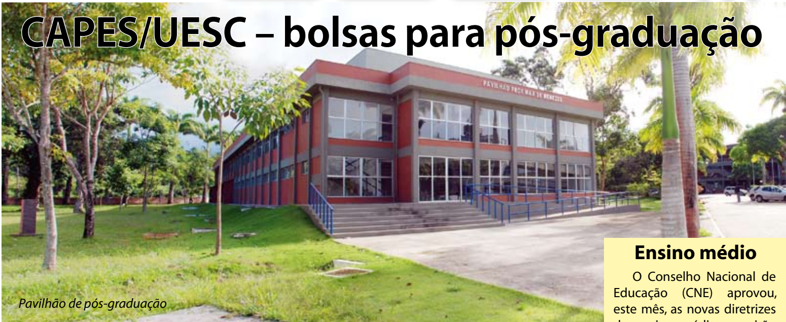
Pavilhão de pós-graduação

A Capes/MEC concedeu uma cota de 39 novas bolsas para os cursos de Mestrado e Doutorado da UESC, segundo o critério de distribuição adotado por aquela instituição. Para tratar