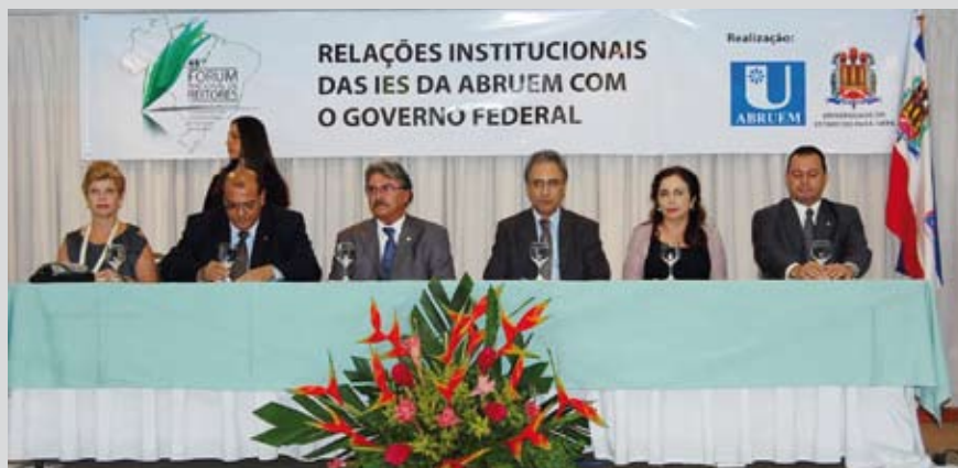
Mesa de instalação do 48º Fórum de Reitores em Belém do Pará.

As políticas do Governo Federal para o avanço da educação universitária e suas oportunidades para as instituições de ensino superior filiadas à Abruem, foi destaque da mesa temática. Objeto também de discussão pelos reitores, as colaborações dessas instituições