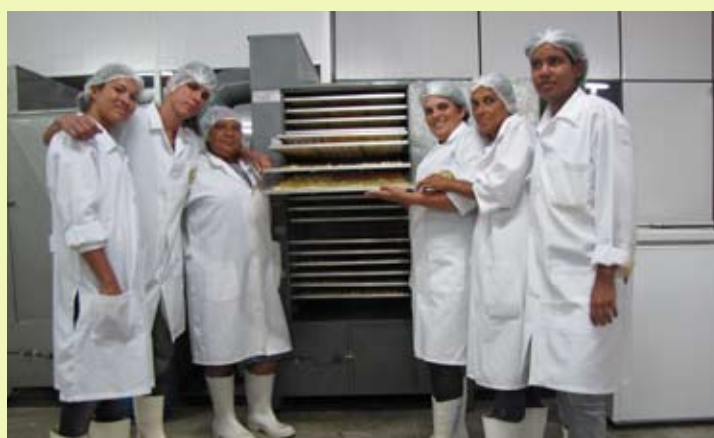
Participante do curso na UESC.

Trinta rurícolas participaram, na UESC, de um curso de extensão sobre “Produção de Frutas Desidratadas”, iniciativa do Programa Agroindústria, do Departamento de Ciências Agrárias e Ambientais (DCAA), com o apoio da Pró-Reitoria de Extensão.