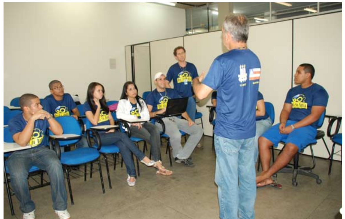
Parte da equipe em reunião.

Ineditismo - Ele explica que estão sendo utilizados materiais naturais,