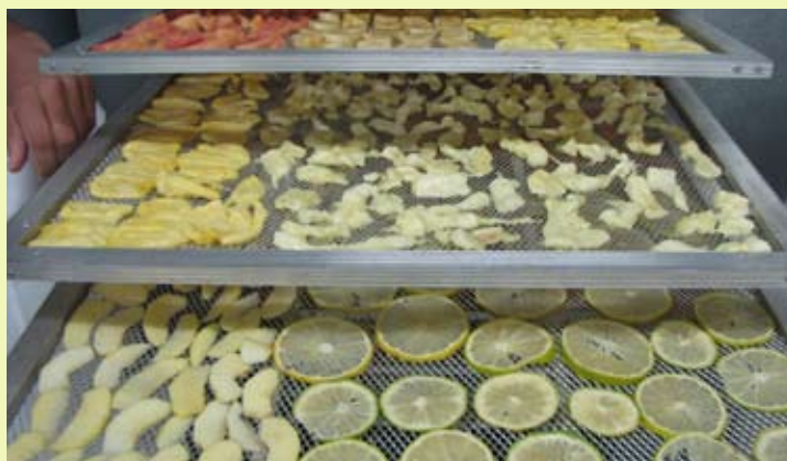
Frutas preparadas para serem desidratadas.