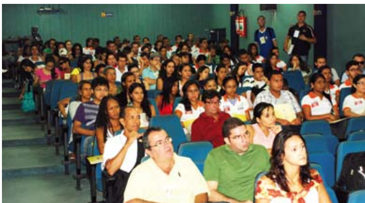
Panorama do público do 1º Workshop da Agroindústria da UESC