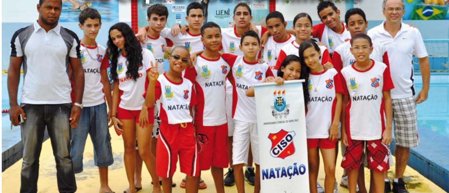
Equipe oficial de natação UESC/CISO

A equipe de natação UESC/CISO, na categoria Entidades Esportivas, conquistou o segundo lugar na 11ª Copa do Descobrimento, realizada na cidade de Porto Seguro, no Extremo Sul da Bahia. Com 238 pontos ganhos, os atletas do projeto de extensão “A UESC nos Desportos Aquáticos” destacaram-se na competição, realizada na piscina do Porto Ação Academia (PAA), com a participa-