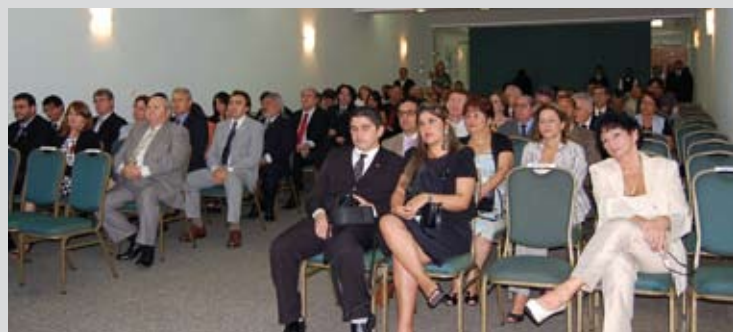
Público formado por reitores das IES.

com a União no campo da ciência, tecnologia e inovação para o desenvolvimento local, e o apoio federal à extensão nas IES como estratégia para a inserção social institucional.