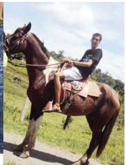
Brincadeiras e atividades em uma fazenda em registros inesquecíveis.