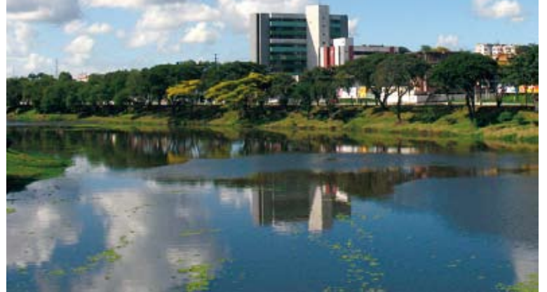
O rio Cachoeira é presença em quase todos os ensaios fotográficos

O presidente da FICC revela que os trabalhos premiados serão montados em uma exposição para visitação pública quando então em sua abertura, na segunda quinzena deste mês fevereiro, acontecerá a entrega das premiações aos vencedores, com a presença do prefeito Nilton Azevedo, autoridades, comunicadores, professores, estudantes, artistas, curiosos e amantes da arte da fotografia, em particular ligada à história de Itabuna.