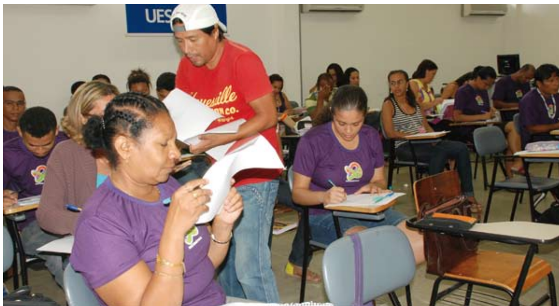
Turma em sala de aula