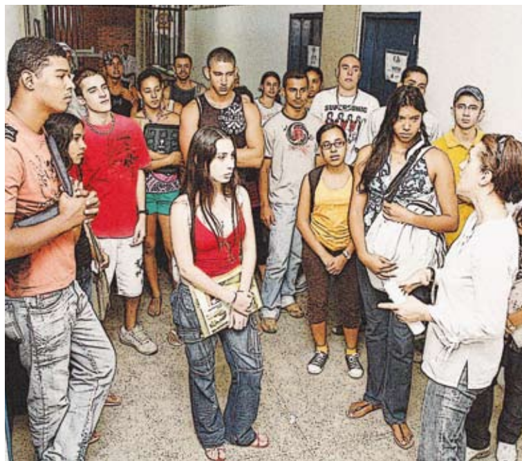
Receber bem os novos alunos sempre foi uma marca da UESC

É, portanto, com esse espírito de integração, confraternização, respeito mútuo e comprometimento, que a comunidade acadêmica da UESC recebe a todos os seus alunos: veteranos e calouros. Sejam bem-vindos!