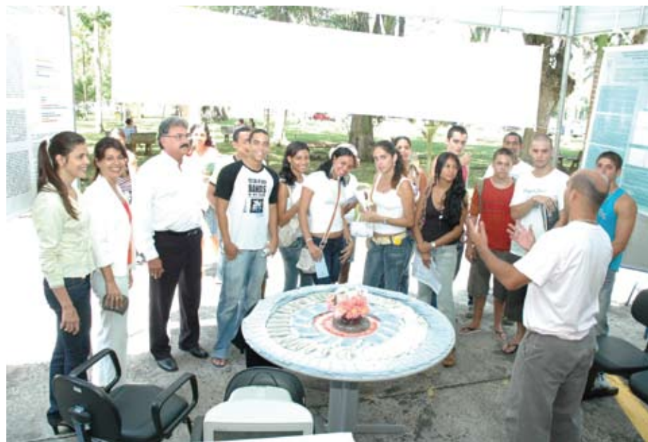
Conhecendo a UESC (Calourada 2010)

A Calourada Acadêmica 2011-1 é, portanto, o “jeito” UESC de promover a integração e a confraternização entre aqueles que são a sua razão de ser: alunos, professores e funcionários.