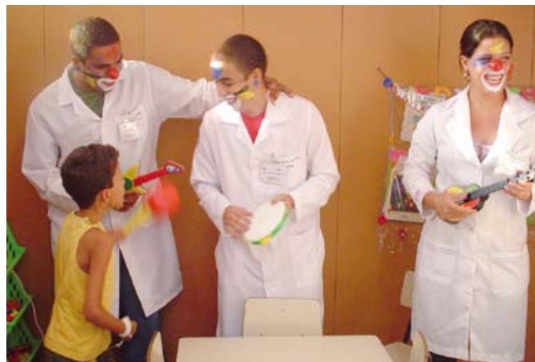
Medicina: Doutors da Alegria (Calourada 2010)