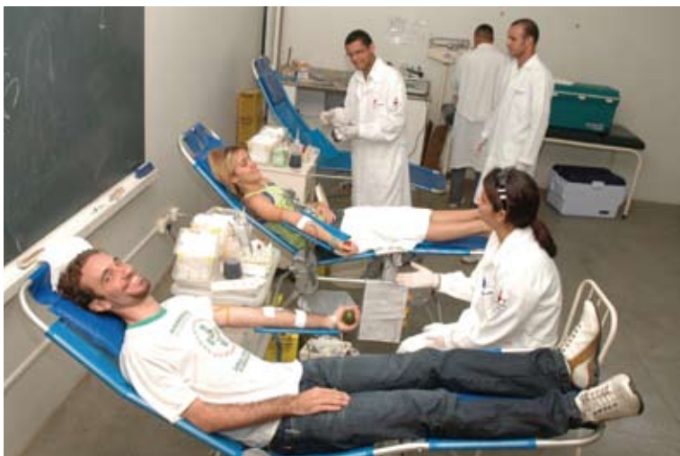
Doação de sangue (Calourada 2010)

Os novos alunos terão uma visão do aprender e fazer acadêmico