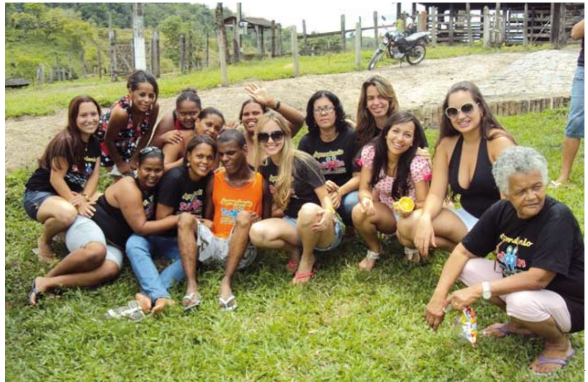
Parte da equipe do projeto, alunos e colaboradores

Entre as dezenas de ações realizadas pelo Núcleo destacamos planfetagem, em Itabuna, pelo Dia Internacional da Síndrome de Down; participação no Seminário “Ser Inclusão”, em Itapetinga; participação em sessão solene no Congresso Nacional, em Brasília e na discussão das Diretrizes da Saúde Mental. Presença também na II Conferência Regional de Saúde Mental, em Itabuna; em encontro pelo “Ser Down”, com o Dr. Zan Mustacchi, em Salvador; caminhada pela inclusão; participação em mesa-redonda no I Encontro da Pessoa com Deficiência do Sul da Bahia, em Itabuna;