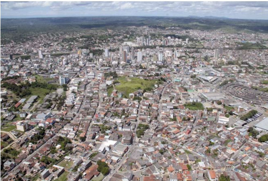
Panoramica de Itabuna

O concurso homenageia a memória de profissionais da arte de fotografia